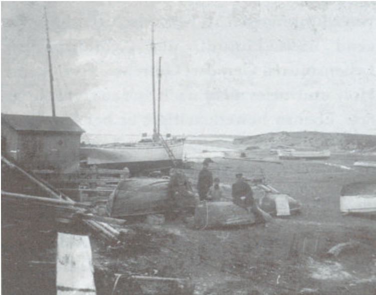
Auf der Munkmarscher Werft