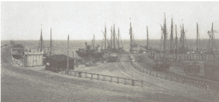
Historische Ansicht von Munkmarsch auf Sylt