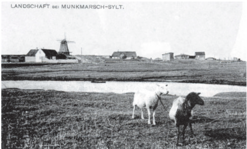
Historische Ansicht von Munkmarsch