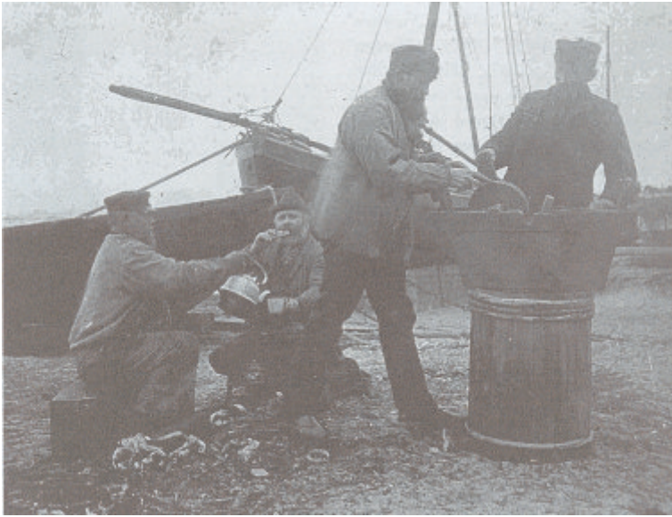
Auf der Munkmarscher Werft